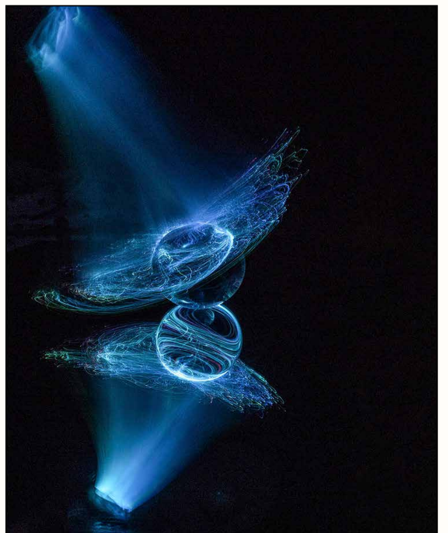
Helmut Hettl »Fantasie 2« - Digital